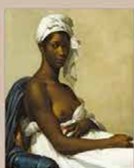
La Vénus hottentote, Eugène Delacroix, 1814. Musée de la Ville de Paris, Paris.