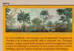
L'Égypte moderne, Eugène Delacroix, 1825. Musée de la Ville de Paris, Paris.