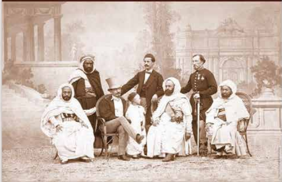
LE DOMAINE COLONIAL FRANÇAIS EN 1850