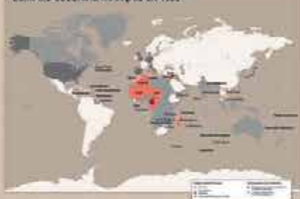
L'EMPIRE COLONIAL FRANÇAIS EN 1930