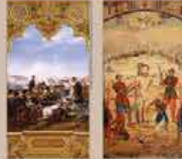
L'Égypte antique, Eugène Delacroix, 1825. Musée de la Ville de Paris, Paris.