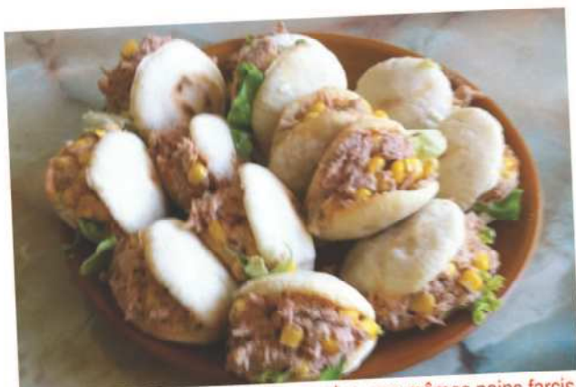
Des batbouts... en période de ramadan, ces mêmes pains farcis sont les bienvenus.