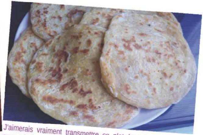
J'aimerais vraiment transmettre ce plat (msemen) qui est un souvenir d'enfance.