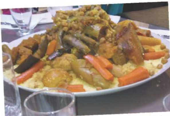
Le couscous me rappelle l'ambiance familiale quand j'étais petite