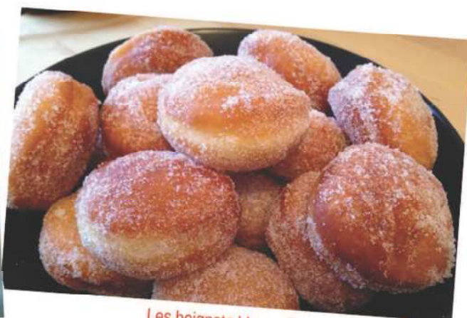
Les beignets ! Le goûter préféré des enfants.