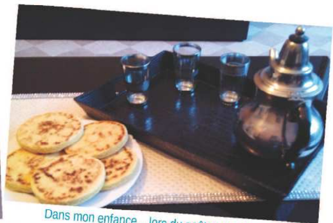
Dans mon enfance... lors du goûter, un régal à l'oriental