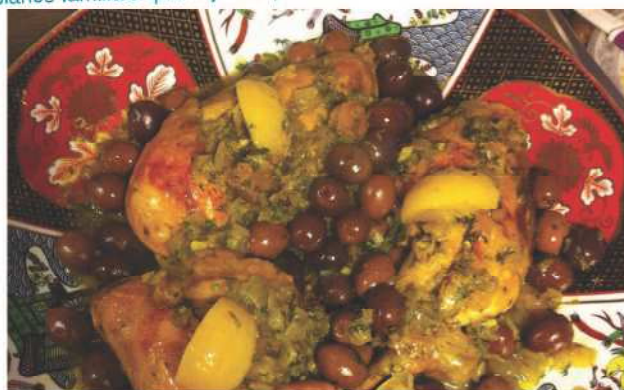
Le poulet aux olives et citrons confits, c'était le plat des grandes occasions. Zohra