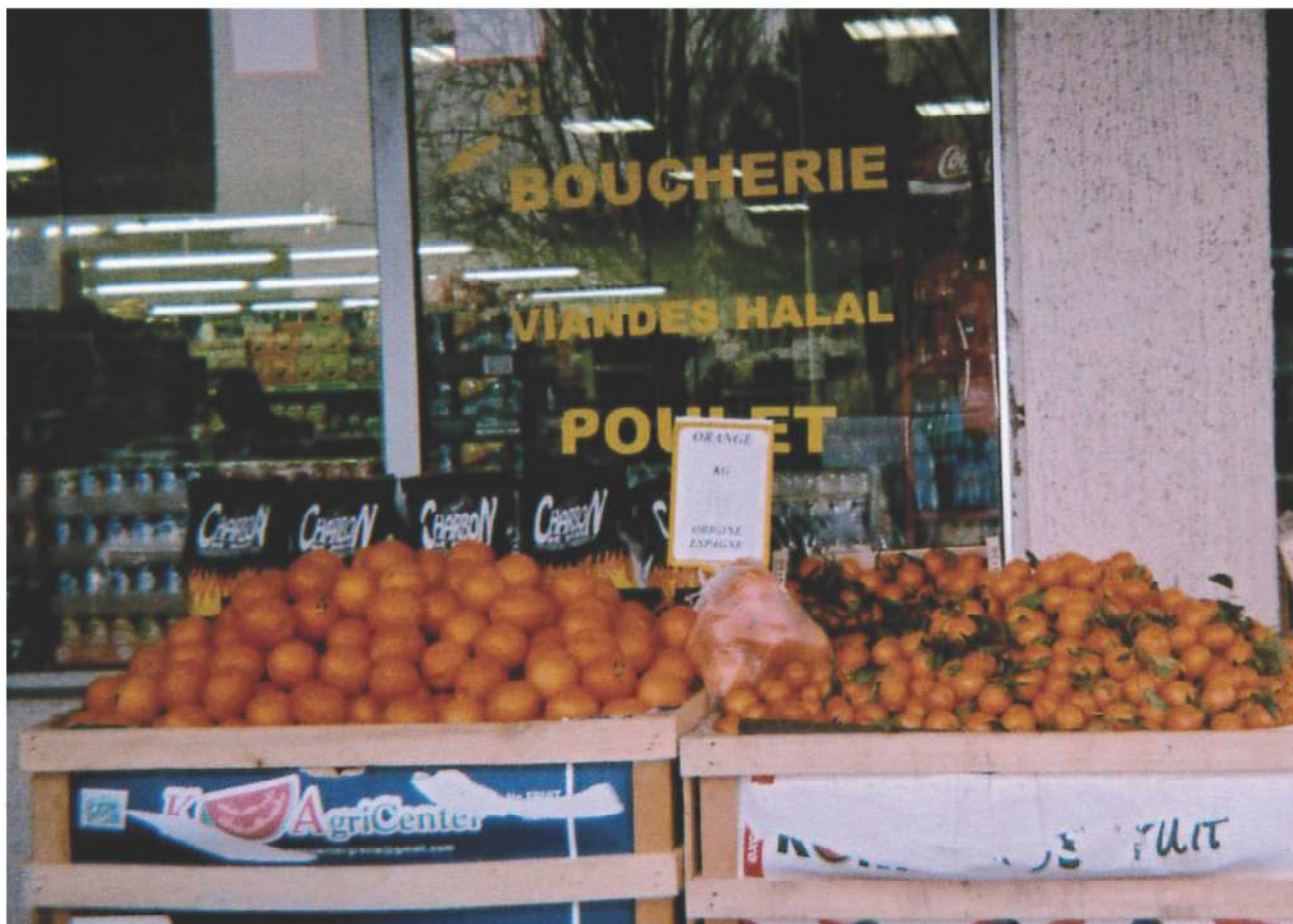
Dans les épiceries on trouve de tout. J'aimerais que les générations futures continuent à faire leurs courses dans un magasin de quartier. Nassira