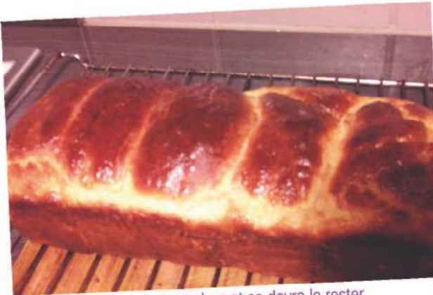
Hum... la brioche c'est trop bon et ça devra le rester.