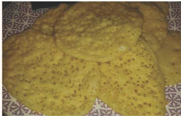
Crêpe aux mille trous, avec du miel, s'il y en a encore c'est meilleur. Zohra