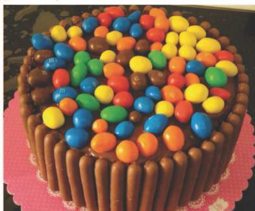
C'est la fête aujourd'hui. Zohra