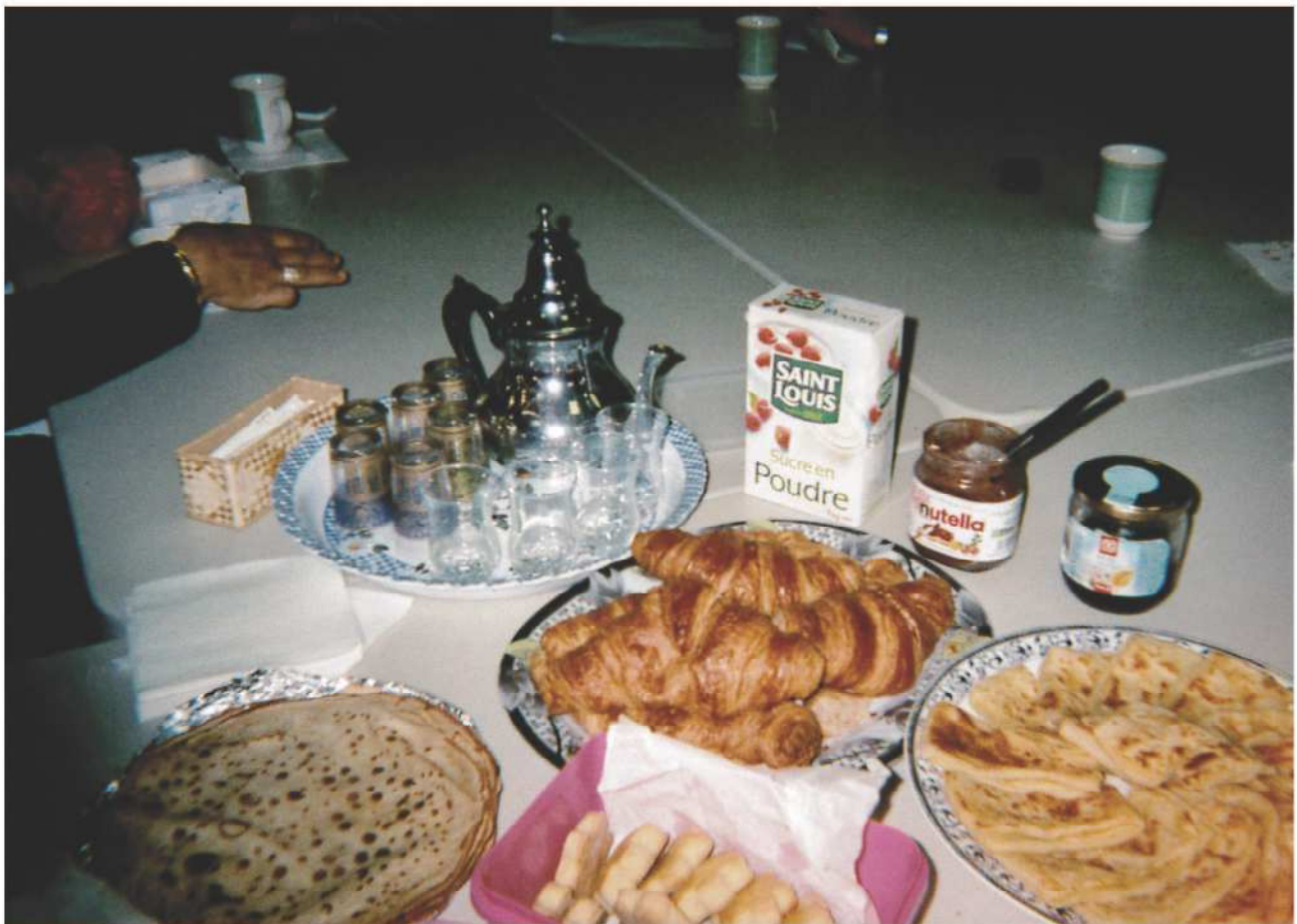
Le thé et ces pâtisseries me font penser à quand j'étais petite, je buvais du thé tous les jours. Je me souviens de mes grands-parents, c'est ma grand-mère qui faisait le thé tout le temps... avec du miel, du vrai miel. Nassira