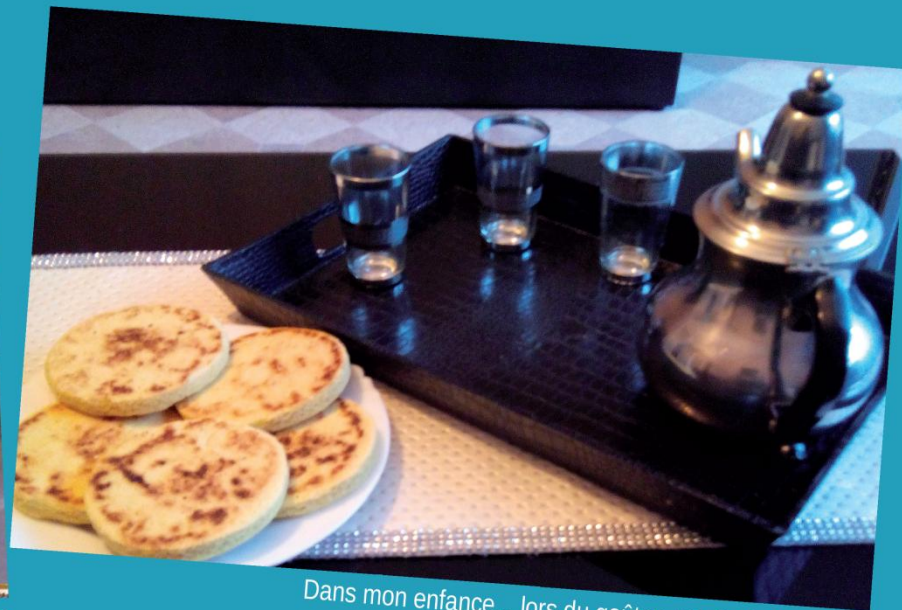
Dans mon enfance... lors du goûter, un régal à l'oriental