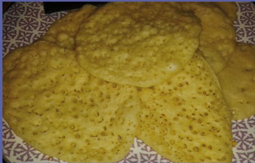
Crêpe aux mille trous, avec du miel, s'il y en a encore c'est meilleur. Zohra