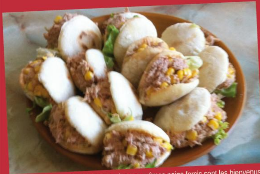
Des batbouts... en période de ramadan ces mêmes pains farcis sont les bienvenus.