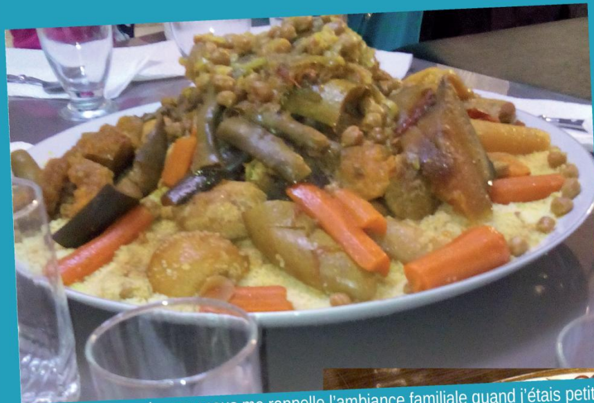
Le couscous me rappelle l'ambiance familiale quand j'étais petite