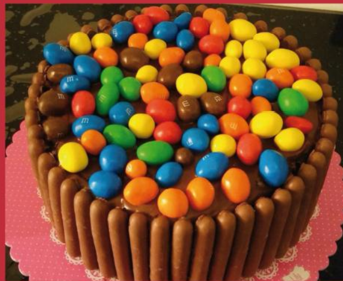
C'est la fête aujourd'hui. Zohra