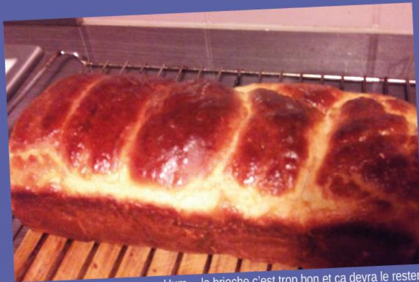
Hum... la brioche c'est trop bon et ça devra le rester.