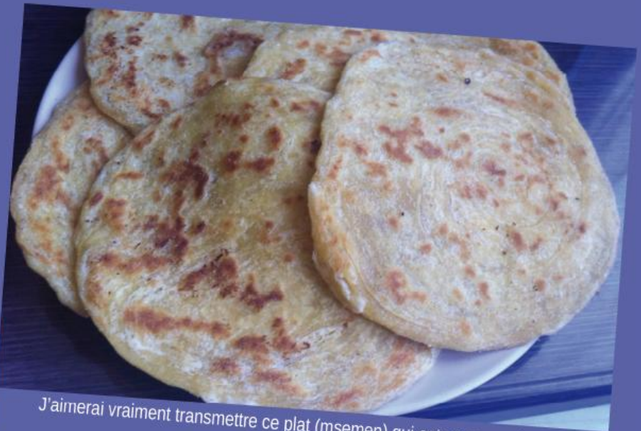
J'aimerais vraiment transmettre ce plat (msemen) qui est un souvenir d'enfance.