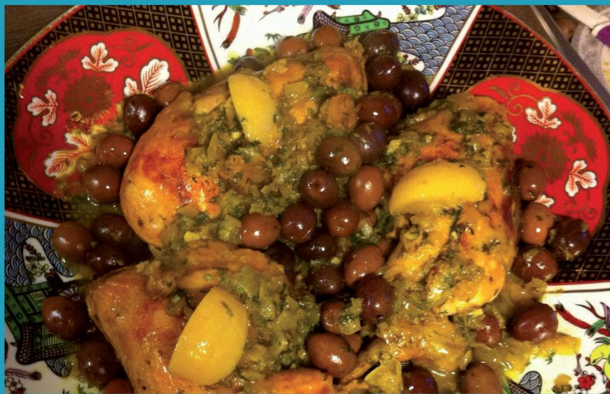
Le poulet aux olives et citrons confits c'était le plat des grandes occasions. Zohra